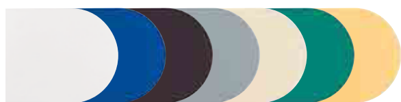
Store à enroulement : tissu opaque

Une palette de 7 coloris pour les supports de mécanisme, chaînette, raccord de chaînette, et anneau de tirage.