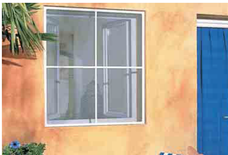
Moustiquaire cadre : L 1,10 x H 1,20 m - Fixe