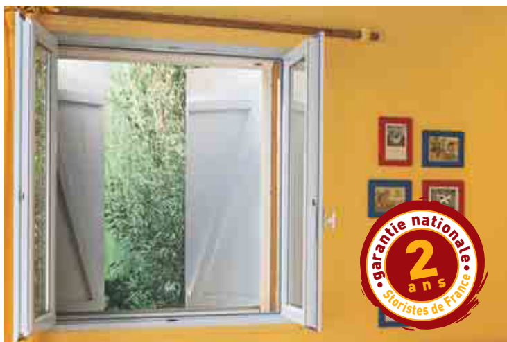
Moustiquaire enroulable : L 1,10 x H 1,20 m - Manœuvre manuelle par tirage direct