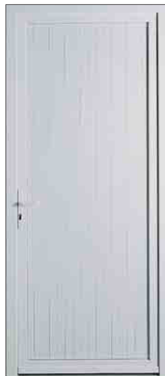
Porte de service pleine