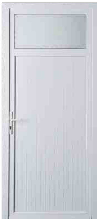
Porte de service avec occulus