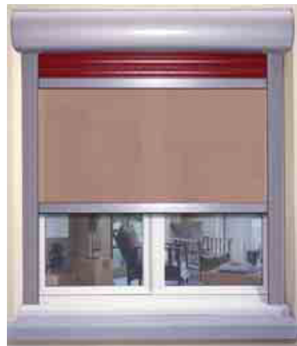
VR Avantage® 2 avec store solaire.