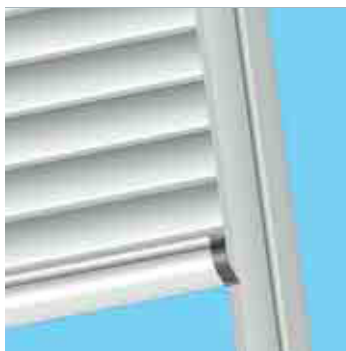
Coulisses et lame finale design.

Un coffre design et discret (13 cm jusqu'à 1m50 de hauteur de fenêtre), et une finition impeccable grâce à lame finale "ferme-coffre".