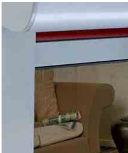
VR Avantage® 2 avec moustiquaire.

Bénéficiez d'une protection solaire ou anti-insectes, en plus du volet roulant : c'est aujourd'hui possible grâce au store ou à la moustiquaire intégrés dans le coffre rénovation.